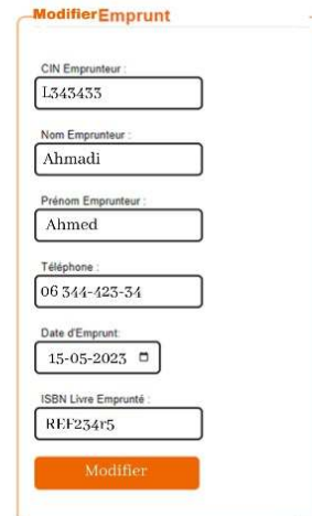
Figure2 : modifier_emprunt.php