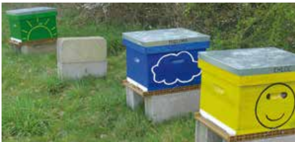
Le rucher est opérationnel sur l'espace de la commune

Le rucher communal est un outil pédagogique qui illustre la notion de bien commun. Par ailleurs, il est le lieu de convergence des deux axes fondateurs de la démarche : diffusion de savoirs et création d'un réseau de relations humaines. Avec le rucher, les habitants font le lien entre la fabrication du miel par leurs abeilles et les ressources alimentaires (fleurs) du paysage.