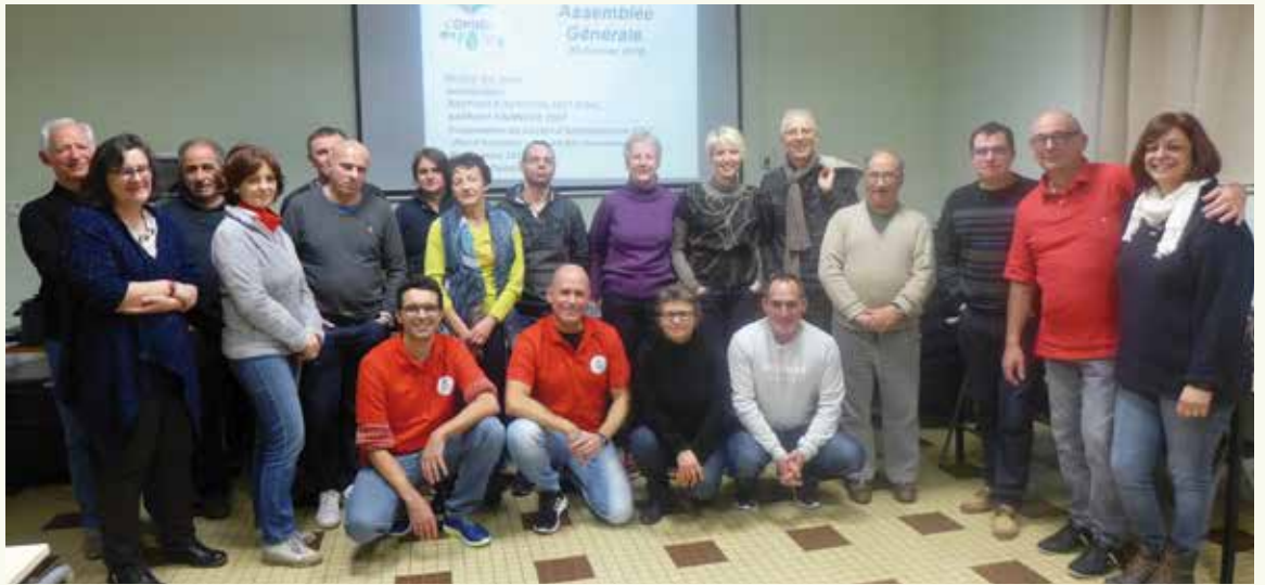
Assemblée générale du 2 février 2018