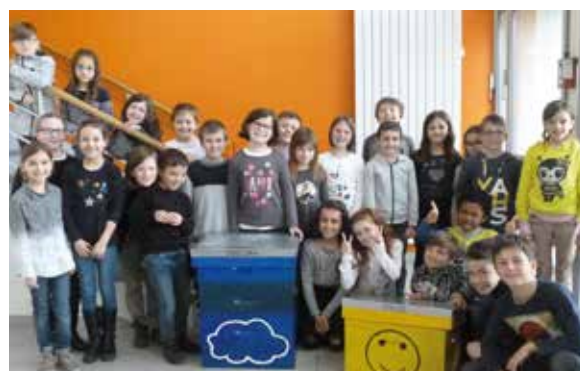
Les classes de CE1 et CE2 de l'école de Jardres